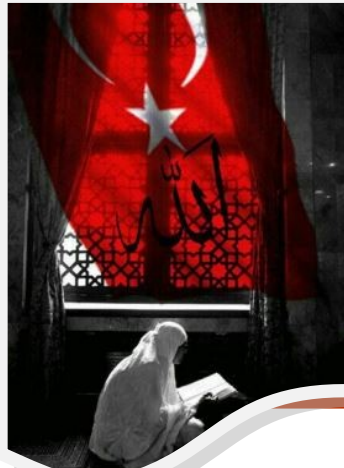
15 TEMMUZ OKUL GAZETESİ

"Cehennem olsa gelen, göğsümüzde söndürürüz. Bu yol ki Hak yoludur, dönme bilmeyiz, yürürüz."